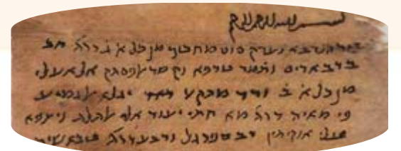
מרשם רפואי שכתב רופא יהודי מהמאה ה-11 בכתב עברי, אך בערבית. המרשם הנו מהגניזה בקהיר.