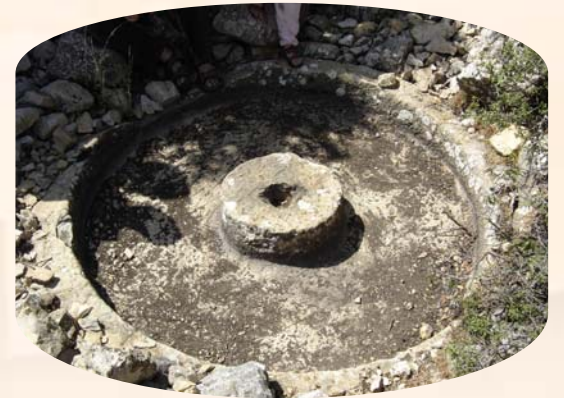
אבן היס בבית בד עתיק בהר מירון