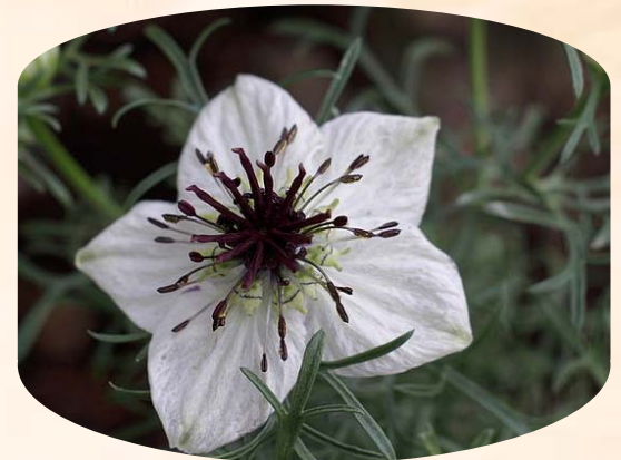
Nigella sativa קצח תרבותי "זרע הברכה"